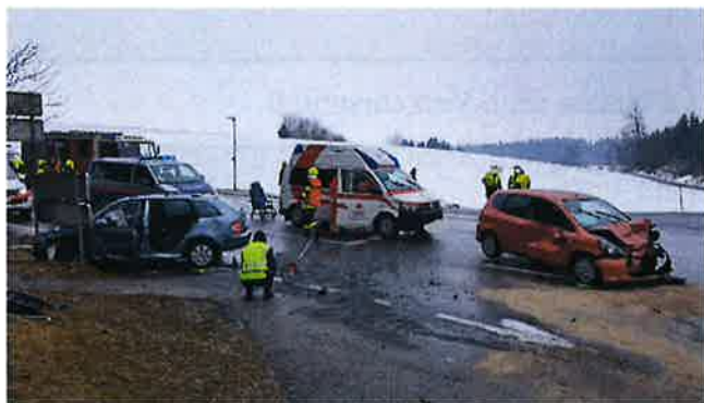
6.3.2018: Verkehrsunfall mit drei Schwerverletzten.

Wir werden uns daher auch weiter darum bemühen, dass möglichst alle aktiven Kameradinnen und Kameraden neben der Grundausbildung auch den Funkkurs sowie im Anschluss die Verkehrsregelschulung absolvieren.