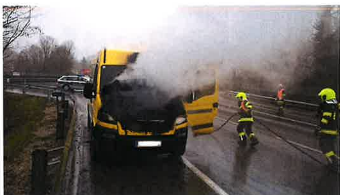
28.03.2018: Kfz-Brand Trenauer Brücke