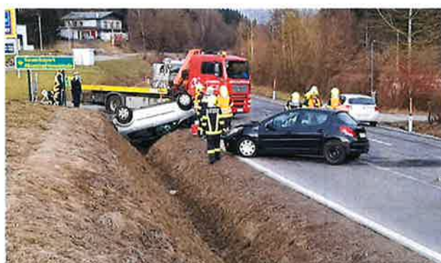
10.3.2018: Unfall mit einer Schwerverletzten, die im Krankenhaus an den Unfallfolgen verstorben ist, und drei Leichtverletzten.