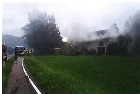
14.09.2018: Wohnhausbrand Gries