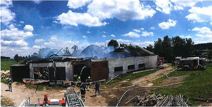
Bauernhofbrand in Hörading

Der Brand eines landwirtschaftlichen Anwesens in Hörading löste einen Großalarm für 20 Feuerwehren aus, da bei diesem Einsatz für die Sicherstellung der Wasserversorgung eine ca. 1,5 km lange Relaisleitung von der Dürren Ager in Unteralberting bis nach Hörading gelegt werden musste.