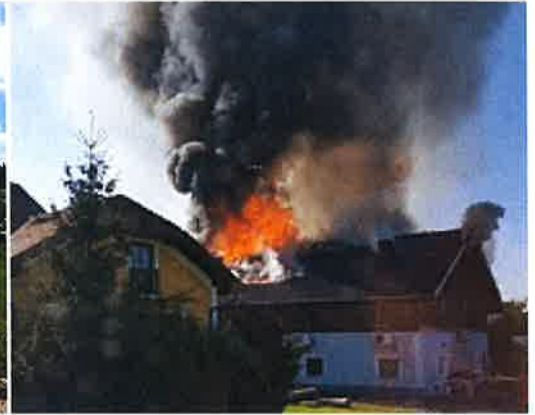
Brand in Mühlberg

Auch beim Brand in Mühlberg musste eine lange Wasserversorgungsleitung von der Vöckla über einen Berghang bis zum Brandobjekt aufgebaut werden. Wir haben im Bereich zwischen der Fa. Platzler-Transport und der Fa. CCS-AKAtch mit unserer TS an der Vöckla angesaugt und gemeinsam mit anderen Feuerwehren die Relaisleitung aufgebaut.